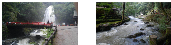
例年の川遊び・昼食の場所状況（8/16）

季節が変われば又、色々な変わった生態・景色が観察できるかもしれませんので、秋にはより多くの方の参加で親子共々楽しみたいと思っています。