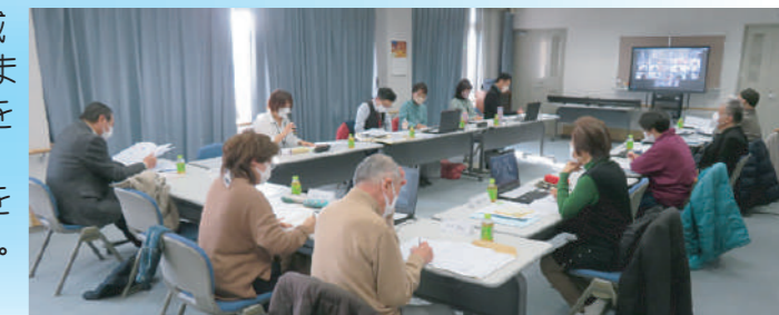
写真手前 左より:保坂社協会長/吉岡/岩下地活協会長

*第2層(各地域単位)生活支援コーディネーター活動とは? 地域での高齢者のつながりづくりに取り組んでいます。